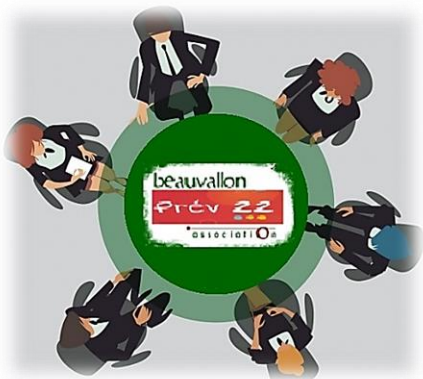
Table ronde n°1

Présentation des activités de Prév'22 sous forme de tables rondes